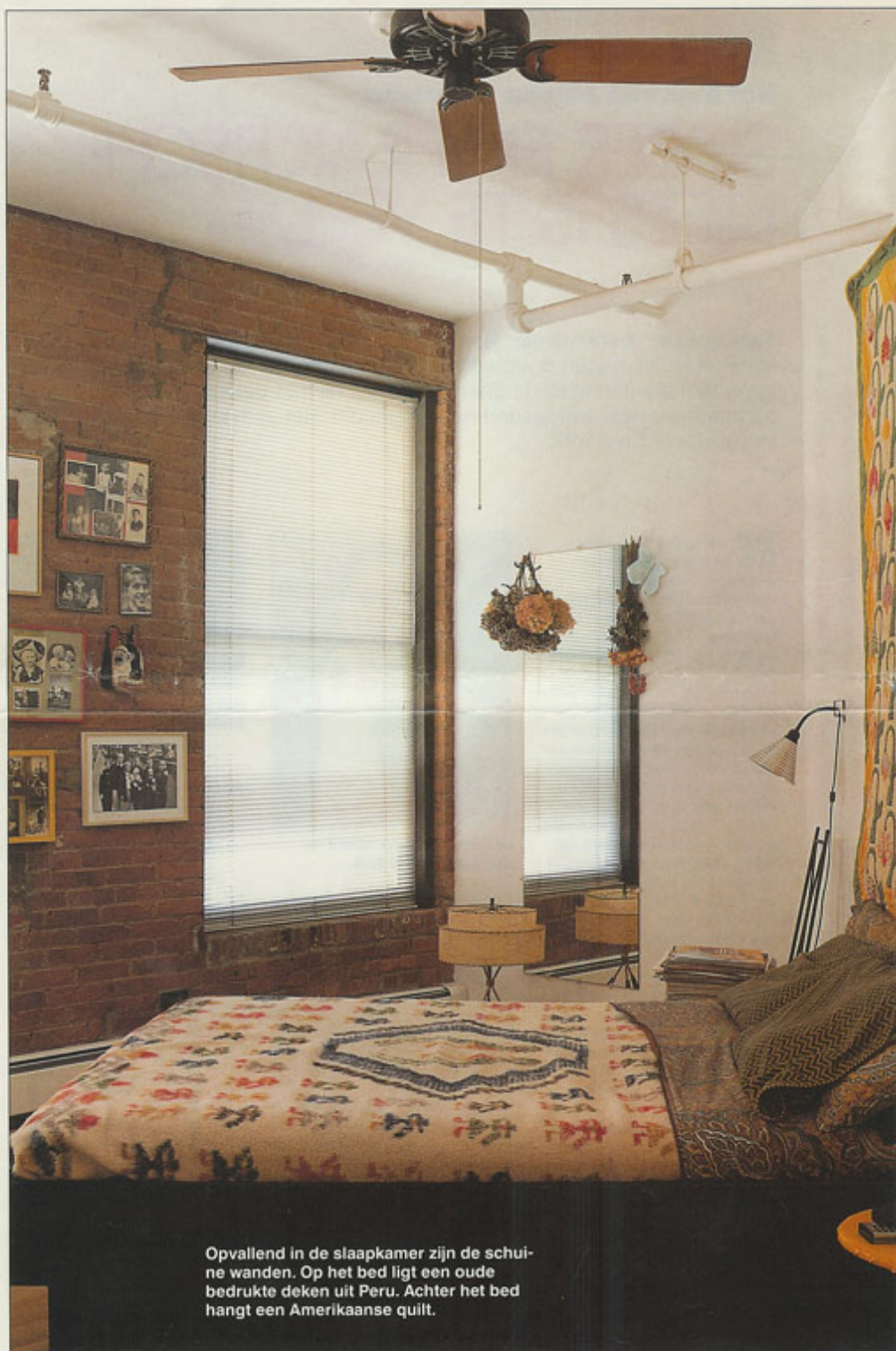
Opvallend in de slaapkamer zijn de schuine wanden. Op het bed ligt een oude bedrukte deken uit Peru. Achter het bed hangt een Amerikaanse quilt.