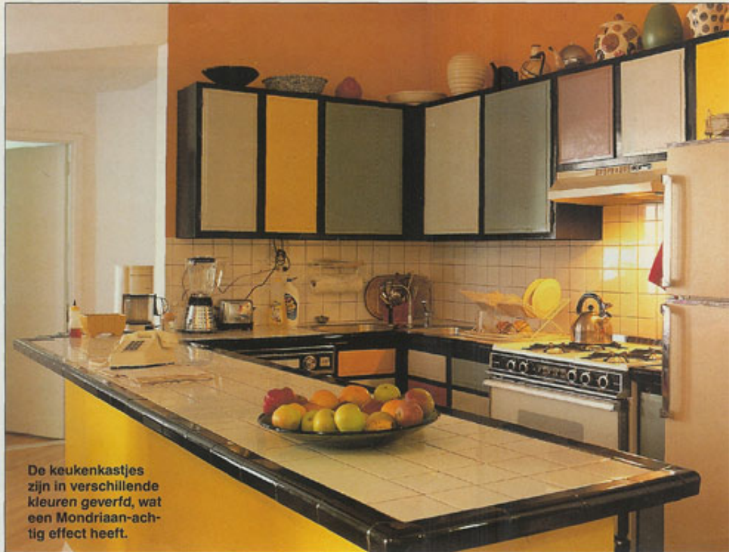
De keukenkastjes zijn in verschillende kleuren geverfd, wat een Mondriaan-achtig effect heeft.