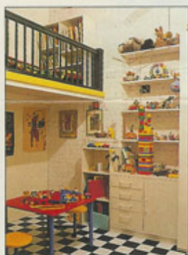
Ruimtewinnend in de kinderkamer: de hoogslaper.

Op die in de keuken na zijn alle binnenwanden wit geschilderd: in de woonkamer en alle slaapkamers. De zuil die midden in de woonkamer staat, is geel geschilderd, de houten planken zijn vervangen door parket. De rode bakstenen muren zijn gelaten zoals ze waren en worden gebruikt om foto's en kunstwerken in zelf gemaakte lijsten aan op te hangen.