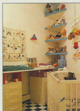
In een hoek is met planken extra afzetruimte gecreëerd.