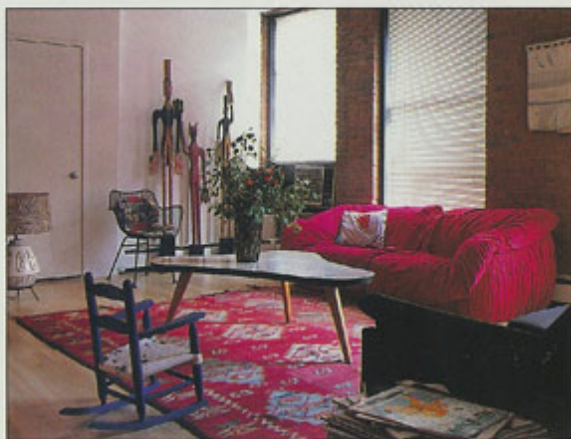
De woonkamer is ingericht met meubels en accessoires uit de jaren vijftig: een salontafel in de vorm van een palet, een kuisstoeltje en een lamp met een beschilderde voet.