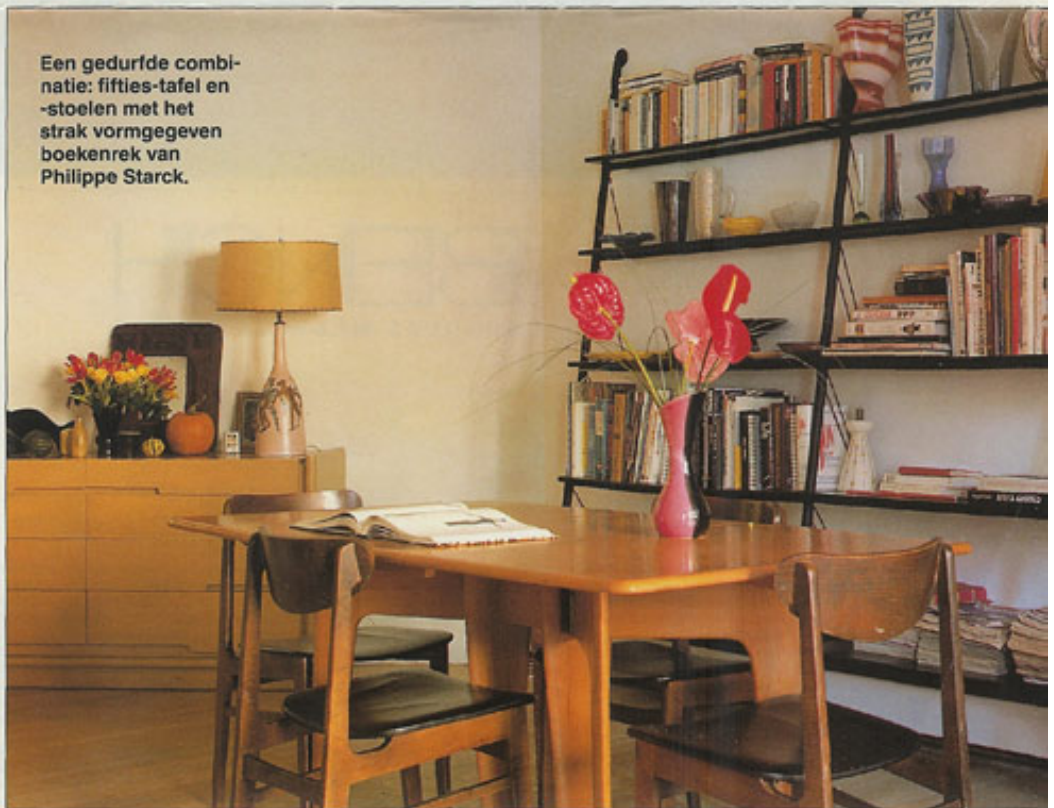
Een gedurfde combinatie: fifties-tafel en -stoelen met het strak vormgegeven boekenrek van Philippe Starck.